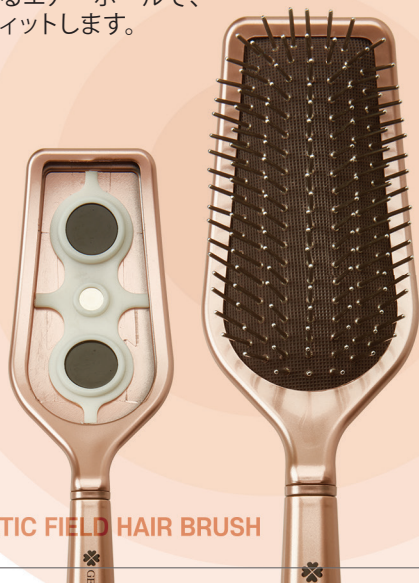
GEMMOVE MAGNETIC FIELD HAIR BRUSH

ジェンムーブ マグネチック ヘアブラシは プラスチックの本体に バイオエネルギーを発生する真鍮ブラシと ゴムパット、貴蛇紋石、 磁石で構成されています。